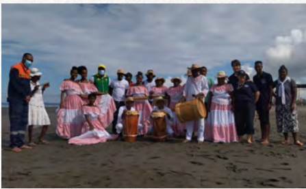
Grupo musical de Punta Soldado

En la comunidad, diferentes grupos representativos conformados por jóvenes, adultos y ancianos fortalecen su tejido social mediante la recuperación y adaptación de tradiciones culturales, gastronomía, manejo de residuos sólidos, generación de energía renovable, turismo comunitario, conservación de manglares y diversas actividades, mejorando así la comunicación, entendimiento y compromiso con la naturaleza. Algunos grupos son: